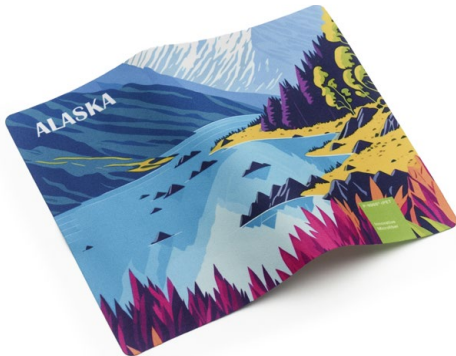
Ansicht des fertigen Displaytuchs